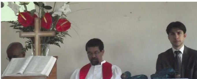
Prêtre et Pasteurs des Églises Malgaches

Pour célébrer la Fête Nationale de Madagascar, un culte œcuménique a été organisée par les 4 congrégations religieuses malgaches de Bordeaux : l'Aumonerie Catholique Malgache (ACMA), le Fiangonana Loterana Malagasy (FLM), le Fiangonana Protestanta Malagasy aty Andafy (FPMA), et le Fiangonana Protestanta Vaovao Malagasy (FPVM).