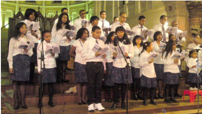
La Chorale Catholique Malgache

La célébration des 30 ans d'existence de l'Association des Catholiques Malgaches d'Aquitaine a débuté le samedi 3 décembre dernier par un concert en l'Eglise Sainte-Marie de La Bastide de Bordeaux.