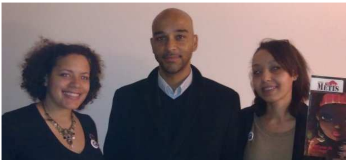
Le Bureau de l'Association Esprit Métis

Depuis leur création en 2006, les membres de l'Association Esprit Métis oeuvrent beaucoup pour le lien entre les cultures. Ainsi, le numéro 10 de leur magazine papier, primé par le prix Zoom de la ville de Pessac, parle de Madagascar à travers des témoignages de plusieurs personnes originaires de l'Île Rouge ou des gens qui y ont simplement séjournés.