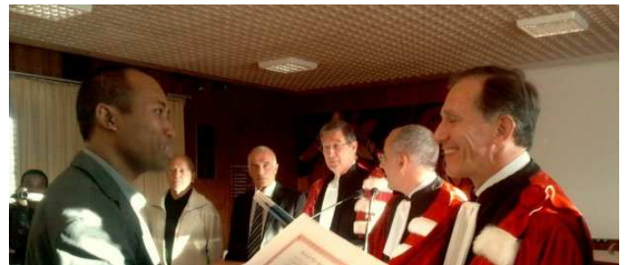
Président et Vice-Président de l'Université de Bordeaux 2