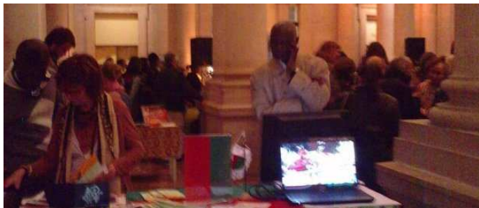
L'Afrique au Musée d'Aquitaine

Bons Baisers d'Afrique, c'est l'occasion de découvrir ou redécouvrir ce continent au fil de propositions artistiques mêlant traditions et modernités dans un cadre original et chargé d'histoire : le Musée d'Aquitaine.