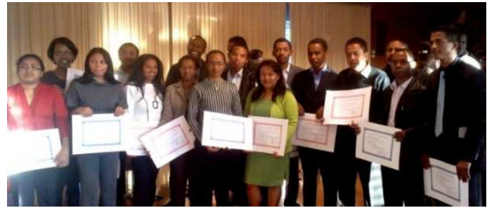
Les Médecins Spécialistes Malgaches