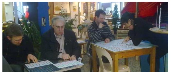
Des joueurs Français s'initiant au Fanorona

Le festival annuel « Les joutes de l'escargot » s'était déroulé au Centre d'Animation du Grand-Parc à Bordeaux durant toute une semaine.