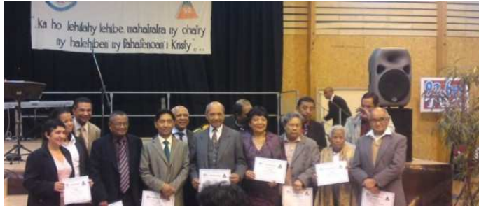
Les Anciens du FPMA de Bordeaux

L'Eglise Protestante Malgache FPMA Bordeaux (Fiangonana Protestanta Malagasy) avait organisé le dimanche 24 octobre un culte suivi d'un repas Agape pour clôturer les cérémonies commémorant leur 50 ans d'existence.