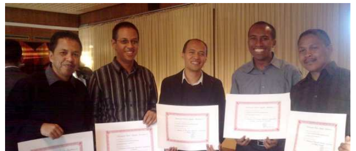
Les nouveaux diplômés

Dans leurs discours, les Chefs de Clinique et les Chefs de Services Hospitaliers ont beaucoup apprécié le professionnalisme de nos compatriotes et comptent sur ces derniers pour contribuer activement à l'amélioration des soins à Madagascar et à la formation des futurs internes.