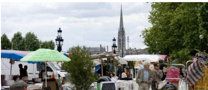
Bordeaux fête l'Afrique et Madagascar

Ainsi, dans notre région les temps forts ont été l'inauguration de la rue des Combattants d'Afrique, l'exposition Les Combattants d'Afrique 1939-1945 au Centre Jean Moulin, la rencontre des bordelais avec les communautés africaines sur la place des quinconces, pour se terminer par une colloque.