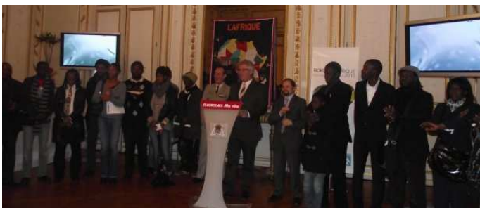
Discours Officiels à la Mairie de Bordeaux

Dans son discours inaugural avec Monsieur Jacques Toubon, Alain Juppé, Maire de Bordeaux avait affirmé que, «l'Afrique représente un partenaire économique et culturel incontournable avec lequel l'Europe construit un développement durable, mutuel et équitable».