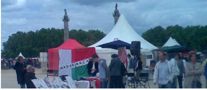
Stands Malgaches sur la Place des Quinconces

Dans le cadre du Cinquantenaire de l'Indépendance de Madagascar, la Communauté Malgache de Bordeaux, les différentes Associations Culturelles et Humanitaires d'Aquitaine pour Madagascar ont tenu à marquer cet évènement.