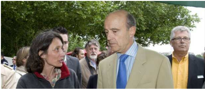
Association Sourire Mirana – M. Alain Juppé