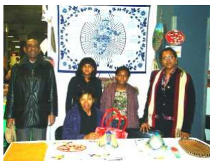
AMICALE FRANCE MADAGASCAR