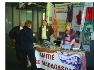
AMITIÉ FRANCE MADAGASCAR